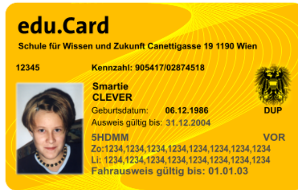
Abb. 2 BMBWK, Vorderseite der edu.card